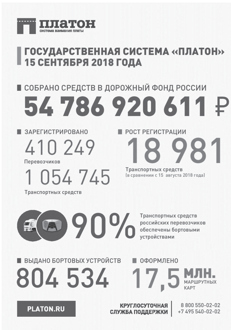
Рис. 3. Инфографика с официального сайта системы «Платон». Загружена 17.09.2018.